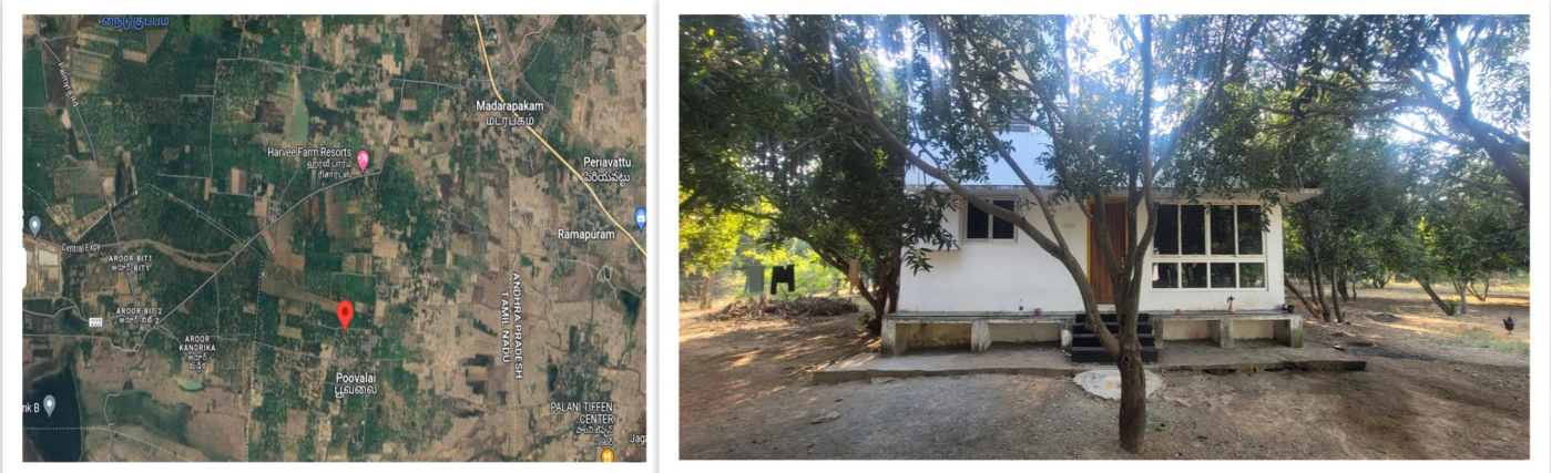
The proposed site is identified at Poovalai Village Near Arambakkam in Gummidipoondi Taluk, Thiruvallur District around 2.5 Acres of Land with small building for “Siddhargal Thiruvadi Seva Trust”